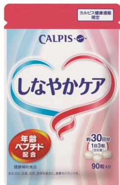
パウチタイプ 90粒入り・約30日分

医療関係者の方へ：ご相談を受けた際は、下記の情報をご確認のうえ、ご判断をお願いいたします。